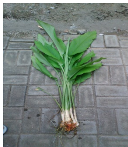
Gambar 1. Tanaman kunyit dari daerah Campurdarat Kab Tulungagung

Hasil dari determinasi menyatakan bahwa simplisia yang digunakan adalah adalah rimpang kunyit dengan spesies Curcuma domestica Val.