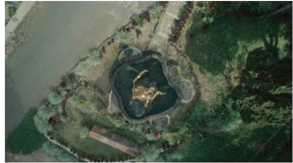
Gambar 8. Patung Roro Kuning

Pada bagian Scene ini menampilkan footage bukit sebagai Intro Title . Pada bagian ini terdapat transisi Backsound , dari backsound openning ke backsound Nusantara agar menghubungkan antar adegan visual dalam video. Pada pengambilan video ini menggunakan drone aerial bertujuan agar dapat menampilkan gambar dari keindahan alas dowo atau rute menuju lokasi wisata Air Merambat Roro.