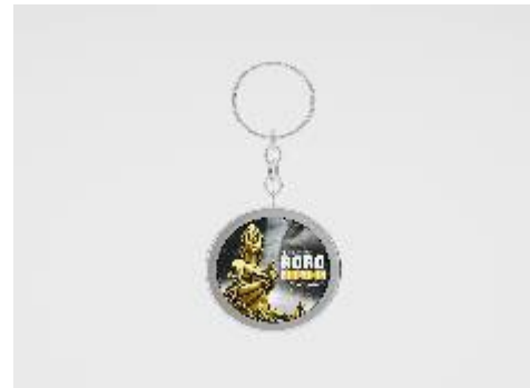
Gambar14. Gantungan Kunci

tempatkan di loket saat pembelian tiket masuk mendapatkan satu stiker per rombongan.