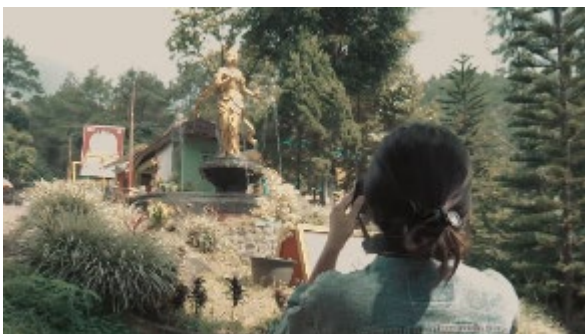
Gambar 7. Patung Roro Kuning