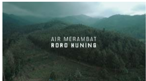
Gambar 5. Intro title

Pada Scene ini menampilkan footage yang melihat bentang persawahan pada video, di video ini juga berisi narasi singkat tentang pesona alam yang ada di desa Bajulan Kabupaten Nganjuk dan berisi Backsound agar memberi dukungan visual dalam video. Pada pengambilan video ini menggunakan drone dan kamera mirrorles dengan berbagai teknik seperti panning , crabing , aerial dan bird eye bertujuan supaya dapat menampilkan visual pada keindahan bentang persawahan yang ada di desa bajulan yang dimana jalan yang mengarah ke lokasi Air Merambat Roro Kuning.