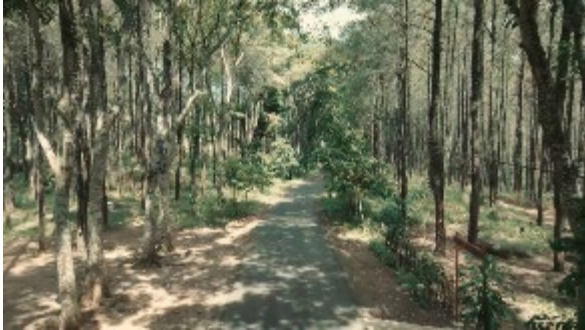
Gambar 6. Hutan Pinus

Pada Scene diatas menampilkan footage jalan kearah pintu masuk ke wisata Air Merambat Roro Kuning, sebelum memasuki pintu masuk terdapat spot untuk foto yaitu hutan pinus. Pada bagian ini terdapat backsound memberikan dukungan pada visual dalam video. Pada pengambilan video ini menggunakan drone aerial bertujuan agar dapat menampilkan gambar dari keindahan hutan pinus sebelum menuju lokasi wisata Air Merambat Roro.