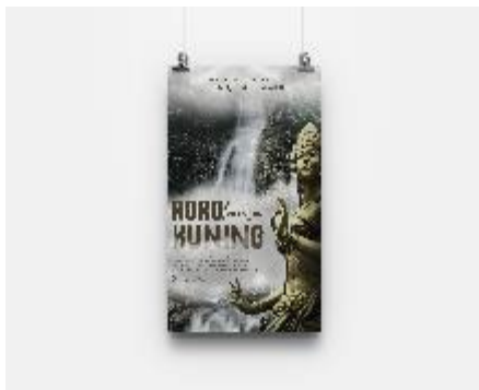
Gambar 12. Poster

Standing X Banner, ini ditempatkan di Dinas Parporabud Kabupaten Nganjuk dan di loket masuk wisata Roro Kuning. Pada media ini berisikan sedikit informasi mengenai wisata Roro Kuning dan lokasi wisata Roro Kuning.