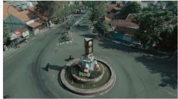
Gambar 3. Tugu adipura kabupaten Nganjuk

Hasil dari perancangan ini berupa project Video promosi yang berjudul “AIR MERAMBAT RORO KUNING” yang berdurasi 3.09 dengan format H.264 Mp4.