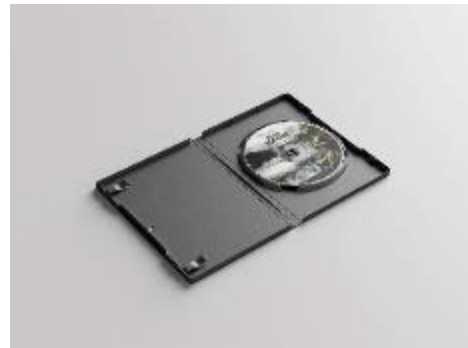
Gambar 9. DVD RW Case

Pada Scene diatas menampilkan footage ikon patung Roro Kuning dan terdapat model dalam video ini, model tersebut sebagai seorang yang menampilkan keseluruhan perjalanan dan memperlihatkan keindahan wisata Roro Kuning. Pada scene ini adegan yang sedang dilakukan model saat berjalan kearah patung Roro Kuning lalu memotret ikon tersebut. Pada bagian ini terdapat backsound memberikan dukungan pada visual dalam video. Di video ini berisi narasi tentang Roro Kuning.