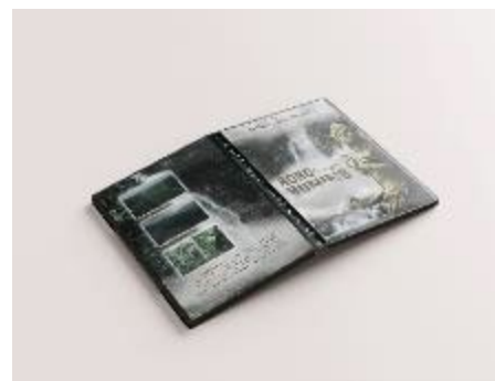
Gambar 10. DVD RW Case

DVD RW Case , merupakan media pendukung yang berisikan hasil jadi media videografi pada perancangan ini, yang nantinya akan di serahkan ke Dinas Parporabud Kabupaten Nganjuk sebagai arsip juga sebagai bentuk promosi pada wisata Roro Kuning dengan media videografi.