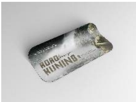
Gambar 13. Stiker

Poster, desain poster yang berkonsep Green Moody . Menampilkan informasi singkat tentang wisata Roro Kuning dan juga lokasi wisata Roro Kuning. Poster ini ditempatkan di instansi pemerintah kota Kabupaten Nganjuk dan pasar oleh-oleh yang ada di Kabupaten Nganjuk.