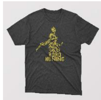
Gambar 15. Kaos

Gantungan kunci , dijadikan sebagai media pendukung, karena souvenir ini sangat menarik di kalangan dewasa dan muda. Desain pada gantungan kunci ini menggunakan vektor ikon Roro Kuning.