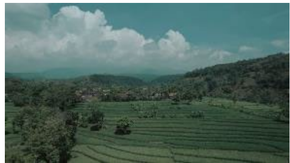
Gambar 4. Persawahan

Adegan dibuka pada Scene diatas menampilkan awal footage kota Nganjuk sebagai opening pada video, di video ini berisi narasi singkat sebagai informasi seputar Kabupaten Nganjuk dan juga terdapat Backsound agar memberi dukungan visual dalam video. Pada pengambilan video ini menggunakan drone dengan teknik aerial dan Bird Eye bertujuan agar dapat menampilkan secara luas kota Nganjuk dan menampilkan tugu Adipura yang menjadi sebagai identitas pada lokasi daerah video tersebut.