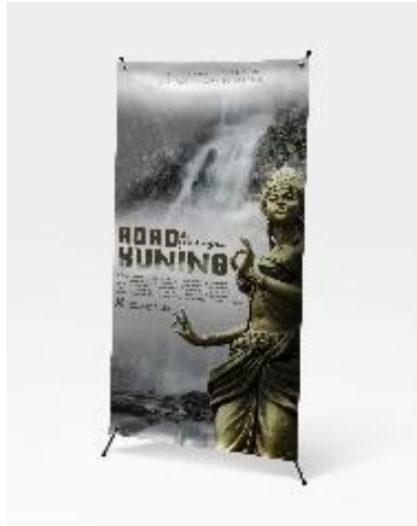
Gambar 11. Standing x banner

Standing X Banner, ini ditempatkan di Dinas Parporabud Kabupaten Nganjuk dan di loket masuk wisata Roro Kuning. Pada media ini berisikan sedikit informasi mengenai wisata Roro Kuning dan lokasi wisata Roro Kuning.