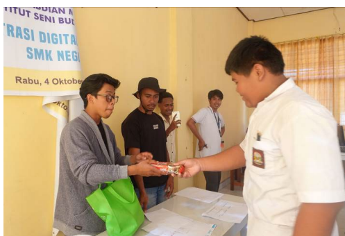
Gambar 8: Pemberian hadiah untuk gambar terbaik karya para siswa