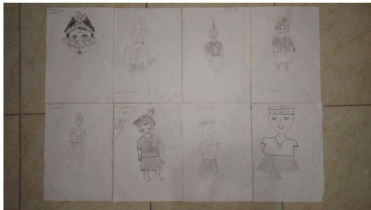
Gambar 13. Hasil sketsa manual objek bebas dari para siswa (2023)