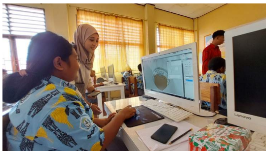
Gambar 17: Praktik coloring digital oleh siswa