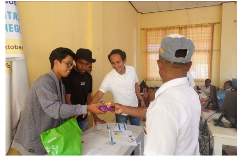
Gambar 9: Pemberian hadiah untuk gambar terbaik karya para siswa