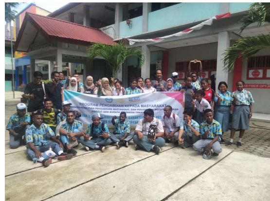
Gambar 22: Foto bersama SMKN 8 dengan tim pelatihan ISBI Tanah Papua