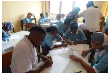
Gambar 5: Siswa menggambar manual karakter Papua