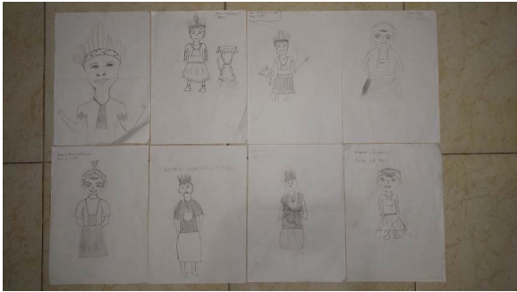
Gambar 12: Hasil sketsa manual objek karakter Papua dari para siswa