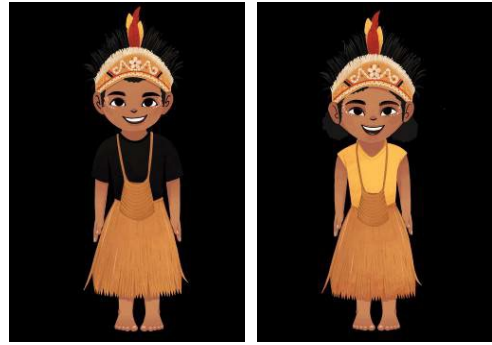
Gambar 1: Digital karakter Papua sebagai referensi yang akan diikuti peserta

Kegiatan pengabdian ini dilaksanakan setelah semua perijinan dan persiapan bahan ajar sudah selesai dilakukan. Adapun pelaksanaan kegiatan dilakukan di SMKN 8 Jayapura dibagi menjadi dua hari agar para siswa sebagai peserta kegiatan dapat membuat karya ilustrasi digital tokoh atau figur karakter Papua dengan maksimal. Pada sesi pertama adalah peserta akan mendapatkan materi pelajaran pemahaman prosedur menggambar ilustrasi dasar secara teoritis dari pemateri dosen, kemudian para siswa akan mencoba menggambar karakter Papua secara manual dengan menggunakan kertas ukuran A4. Sesi ini berlangsung dari jam 08.00 WIT hingga 14.00 WIT.