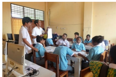
Gambar 6. Siswa menyimak pemaparan dari pemateri