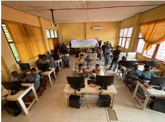
Gambar 19. Foto bersama peserta siswa SMKN 8 dengan tim pelatihan ISBI Tanah Papua

Diakhir kegiatan ditutup dengan penyerahan plakat sebagai simbol kerjasama dan ucapan terima kasih dari ketua tim pelatihan mewakili Kampus ISBI Tanah Papua kepada pihak sekolah SMKN 8 Jayapura serta diakhiri dengan foto bersama para siswa, guru, pimpinan SMKN 8 Jayapura dengan tim pelatihan.