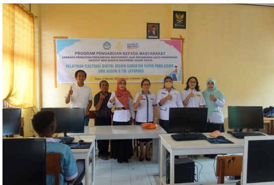
Gambar 3: Foto bersama pimpinan dan Pejabat Dinas Pendidikan Kota Jayapura

Setelah itu kegiatan dilanjutkan dengan pengenalan tim pelatihan yang terdiri dari ketua