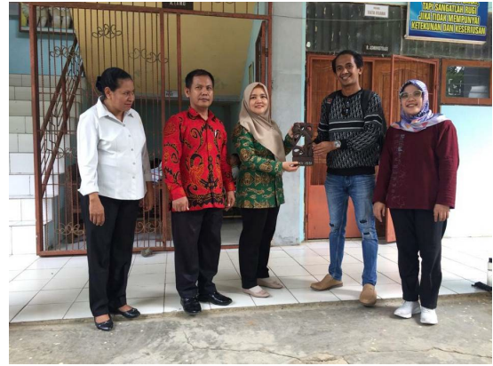
Gambar 21. Foto penyerahan plakat dari ketua tim pelatihan kepada pihak SMKN 8 Jayapura