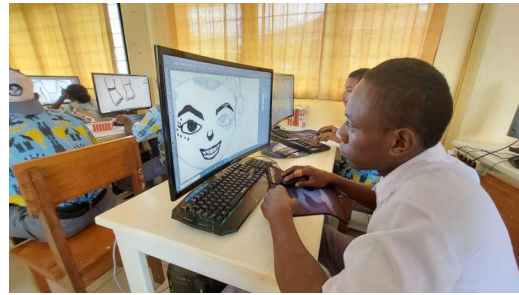
Gambar 15. Praktik outline digital oleh siswa

warna yang akan diaplikasikan pada gambar digital karakter Papua.