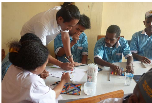
Gambar 7: Pemateri membantu mengarahkan siswa cari membuat sketsa gambar manual Sumber: Dokumen pribadi (2023)

Tujuan dari sesi pertama ini adalah untuk mengukur kemampuan para siswa dan melatih keterampilan dalam menggambar sketsa manual sebagai dasar untuk membuat sketsa digital. Selain itu para siswa juga dituntut untuk dapat bekerja sama sebagai tim dalam memberikan ide gagasan untuk menciptakan suatu karya poster promosi SMKN 8 Jayapura. Para siswa akan diberikan media gambar berupa kertas, pensil dan penghapus. Tim anggota pendamping (mahasiswa) membantu mengarahkan dan membimbing siswa dalam menggambar sketsa manual. Untuk menambah kemeriahan para siswa juga diberikan reward berupa hadiah untuk hasil gambar yang terbaik.