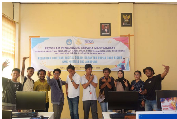
Gambar 20. Foto bersama peserta siswa SMKN 8 dengan tim pelatihan ISBI Tanah Papua