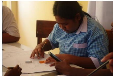
Gambar 4. Siswa menggambar manual Bebas 10 objek

Kegiatan dilanjutkan dengan pemaparan bagaimana menggambar ilustrasi secara teoritis dari pemateri dosen, kemudian para siswa akan mencoba menggambar karakter Papua secara manual dengan menggunakan kertas ukuran A4. Sesi ini berlangsung dari jam 08.00 WIT hingga 14.00 WIT. Gambar dibuat dibagi menjadi tiga sesi yaitu setiap siswa membuat 10 gambar objek bebas; siswa membuat contoh gambar karakter yang diberikan oleh pemateri; dan yang terakhir adalah para siswa dibagi menjadi 5 kelompok (tiap kelompok terdiri dari 5 siswa) dan diminta belajar bekerjasama untuk membuat gambar sketsa poster manual dengan tema promosi SMKN 8 Jayapura.