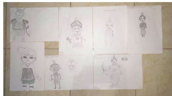
Gambar 11: Hasil sketsa manual objek karakter Papua dari para siswa