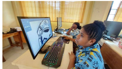
Gambar 16. Praktik outline digital oleh siswa Sumber: Dokumen pribadi (2023)