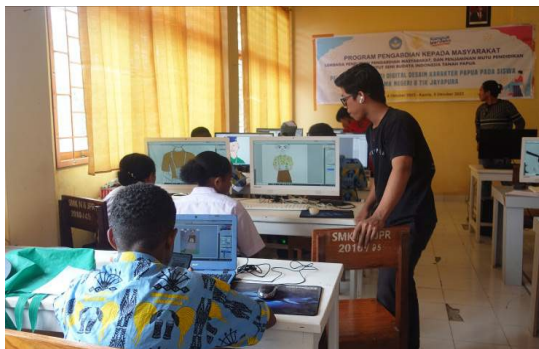
Gambar 18. Praktik coloring digital oleh siswa