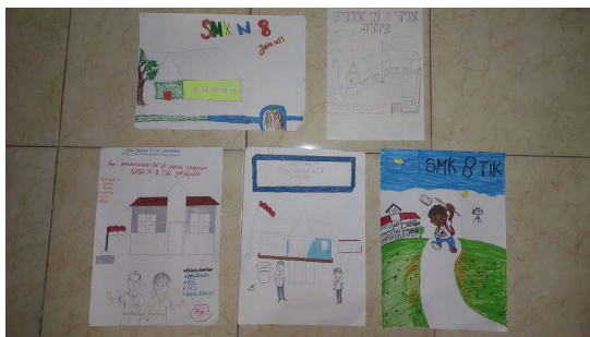
Gambar 14. Hasil sketsa manual berkelompok, gambar poster promosi SMKN 8 Sumber.