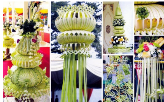
Gambar 2. Disain janur