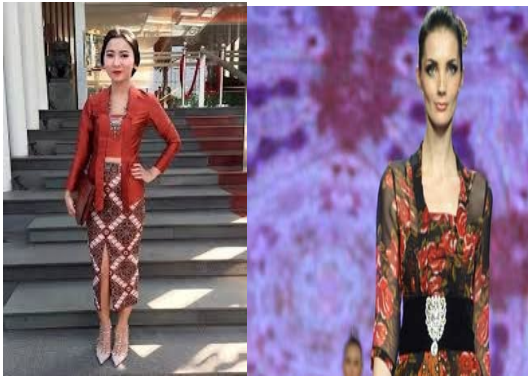
Gambar 3. Fashion anak dan ibu