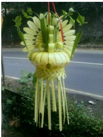
Gambar 1. Disain Janur

Disain Arsitektur untuk Galeri Janur akan dilakukan oleh Arsitektur khusus yang mampu menginterpretasikan tradisi seni budaya jawa kedalam bangunan modern yang menggambarkan filosofi tradisi seni merangkai janur. Pada rancangan bangunan penulis menginginkan pengadaan ruang sebagai berikut: