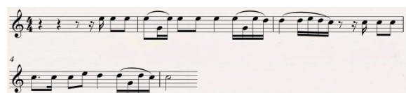
Gambar 6. Notasi 5. Frase antiseden pada melodi utama lagu Kumbang Balombak versi pop Minang.