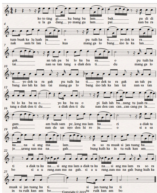
Gambar 4. Notasi 3. Sampelong (dendang Kubang Balombak) versi Kardi Tanjung

Beberapa aspek yang akan dianalisis dari kedua notasi di atas adalah: melodi utama ( main melody ), tangga nada, lirik, tanda sukat, tempo, gaya atau style .