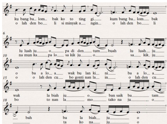
Gambar 3. Notasi 2. Dendang sampelong Kubang Balombak tradisi

Balombak tradisi setelah bertransformasi menjadi lagu pop Minang, maka akan diuraikan perubahan lagu Kubang Balombak dari berbagai aspek. Untuk menguraikan perubahan tersebut, akan dibandingkan lagu Kubang Balombak versi tradisi dengan Lagu Kubang Balombak versi pop Minang, maka dalam hal ini dipilih salah satu lagu pop Minang versi yang dibawakan oleh penyanyi Kardi Tanjung. Notasi berikut adalah melodi utama dendang sampelong Kubang Balombak tradisi dan melodi utama dendang sampelong pop Minang versi Kardi Tanjung.