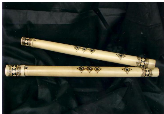
Gambar 1. Alat musik sampelung

Sampelung merupakan alat musik tiup ( aerophone ) yang sangat penting bagi masyarakat Nagari Talang Maua. Sampelung terbuat dari poriang (salah satu jenis bambu). Alat musik ini memiliki panjang berkisar 30-66 cm, berdiameter 4-6 cm dan memiliki lubang nada sebanyak 4 buah (lihat gambar 1).