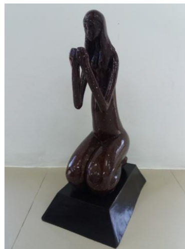
Gambar 7 Judul “Ketulusan” Ukuran 60 cm Teknik casting 2017

Karya ke tujuh ini, karya patung yang berjudul “Ketulusan” memvisualkan seorang ibu yang berambut panjang terurai sedang duduk bersimpuh. Kedua telapak tangan terangkat ke atas hingga tepat di depan dada.