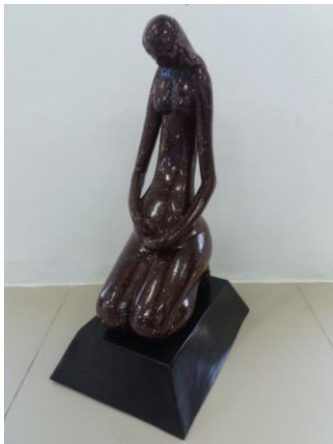
Gambar 2. Judul “Penantian yang panjang” Ukuran 60 cm Teknik casting 2017

Karya kedua ini, karya patung yang berjudul “Penantian yang Panjang” memvisualkan seorang ibu yang sedang duduk bersimpuh. Pada karya terdapat seorang ibu yang berambut panjang dengan gerakan kedua tangan yang mengelus perutnya yang besar sambil menundukan kepalanya menghadap kebawah.