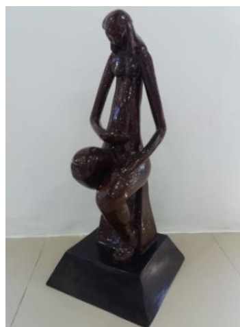
Gambar 1. Judul “permulaan” Ukuran 60 cm Teknik casting (2017)

Karya pertama ini berjudul “Permulaan” memvisualkan seorang ibu yang sedang duduk di atas batu dengan mengangkat dan melipat satu kaki. Sosok ibu berambut panjang dengan gerakan tangan yang mengelus perutnya yang sedikit membesar dengan kondisi kepala menunduk.