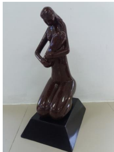
Gambar 4. Judul “Kasih syang” Ukuran 60 cm Teknik casting 2017

Karya keempat ini, karya patung yang berjudul “Kasih Sayang” merupakan bentuk dari visualisasi seorang ibu yang sedang duduk bersimpuh sambil menggendong bayinya. Ibu yang berambut panjang sambil menundukan kepalanya menghadap wajah anaknya. Pada karya ini terlihat ibu yang sedang menyusui anaknya dengan gerakan kedua tangan si ibu memeluk bayi dan menempelkan wajah bayi ke payudaranya.