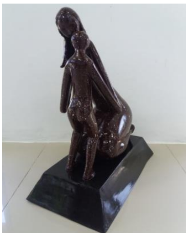
Gambar 6. Judul “Ungkapan Cinta Ibu” Ukuran 60 cm Teknik casting 2017

Karya ke enam ini, karya patung yang berjudul “Mendidik” memvisualkan seorang ibu yang sedang berjongkok mencium kening anaknya. Terdapat figur yang lain ada anak yang sedang memegang tangan ibunya. Seorang ibu yang berambut panjang dengan gerakan si anak menghadapkan keningnya kepada ibu dan ibu mencium kening anaknya.