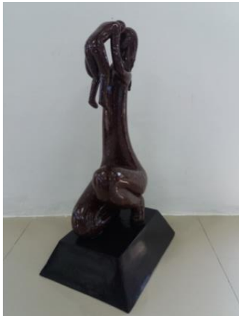
Gambar 5 Judul “Ungkapan Cinta Ibu” Ukuran 60 cm Teknik casting 2017

Karya kelima ini, karya patung yang berjudul “Ungkapan Cinta Ibu” memvisualkan seorang ibu berambut panjang yang sedang mengangkat anaknya sambil mendekatkan kepala anak ke kepala si ibu. Kedua tangan antara ibu dan anak terlihat menyatu. Posisi ibu yang sedang berjongkok dengan menjinjitkan telapak kaki kiri hingga menempel pada bokong bagian kiri. Sedangkan posisi kaki kanan dengan gerakan bersimpuh. Pada figur anak posisi kaki terlihat tergantung dan posisi badan yang terangkat.