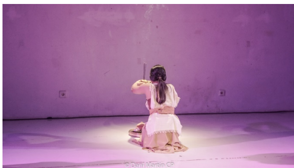
Gambar 3. Adegan Pembuka karya Majir

Pada adegan pembuka biasanya merupakan penjabaran identitas tokoh. Dalam adegan ini