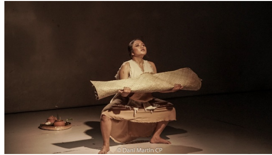
Gambar 5. Adegan persetubuhan sebagai betuk usaha Inai memiliki anak.

Pada adegan kedua, tokoh Inai mengvisualkan usaha-usahanya untuk mendapatkan seorang anak dalam bentuk gerakan bersetubuh dengan suaminya. Gerakan ini dilakukan Inai dengan menggunakan tikar yang diinterpretasikan sebagai suaminya. Gerakan persetubuhan ini merupakan simbol-simbol saja agar tidak terlihat fulgar dan masih bisa dinikmati sebagai sebuah aksi seni.