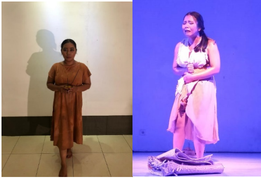
Gambar 2. Kostum tokoh Inai dan Penari