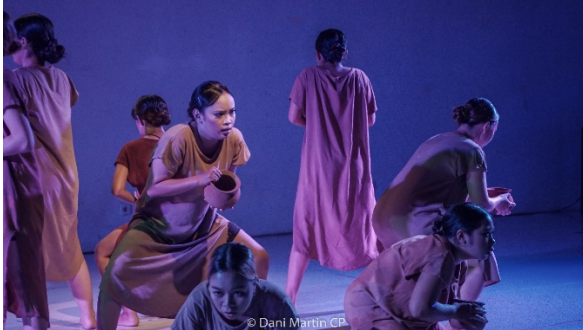
Gambar 6. Penari mencari ari-ari bayi mereka