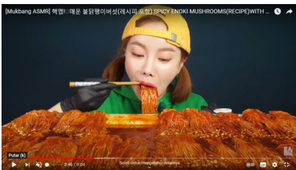
Gambar 3. Video Mukbang ASMR menikmati makanan dengan efek suara unik dari kecapan mulut dan gigi yang menggigit makanan ( https://youtu.be/xwJMSA5yTtY , unduh Rio 12/03/2021 8:05)

San Jose 1, Ca bersama Nice Dence Academy USA dalam karya “The Night We Met” diunggah oleh Spotlight Dance Cup dalam link channel Youtube https://youtu.be/HlrWeqfDawg (2018). Sebagaimana deskripsinya bahwa karya dalam video ini adalah merupakan karya nominasi Industry Dance Awards 2018.