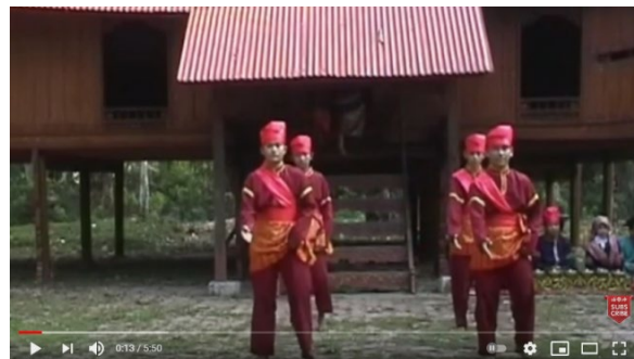
Gambar 1. Menari dengan latar belakang rumah adat LontioK khas Kampar, menginspirasi setting panggung untuk karya pertunjukan Bajambau .

Tulisan Hafizah dalam jurnal Jom FISIP , volume lima edisi ke-2 tentang “Tradisi Makan Bajambau di Desa Salo Timur Kecamatan Salo Kabupaten Kampar” (2018). Tulisan tersebut bersifat deskriptif analitis yang menyatakan bahwa tradisi Bajambau masih hidup di Desa Salo Timur, Kecamatan Salo, Kabupaten Kampar. Tradisi tersebut pada dasarnya mengandung nilai-nilai sosial berupa kebersamaan dan gotong royong, sementara nilai adat yang terkandung berupa upaya konservatif mentransmisikan adat dan pengetahuan Bajambau kepada generasi penerus untuk memastikan eksistensinya dalam perkembangan zaman.