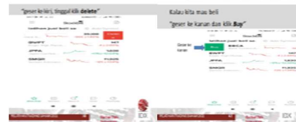
Gambar 7. Grafik analisa harga saham

Metode simulasi disini yang dimaksud adalah para peserta diberi simulasi dan dipersilahkan untuk membuka ID di aplikasi stockbitnya masing-masing. Peserta bisa membuka IDnya sendiri dan bisa melihat histori harga saham baik dengan menggunakan candle stick, grafik maupun dengan penampilan berupa diagram batang