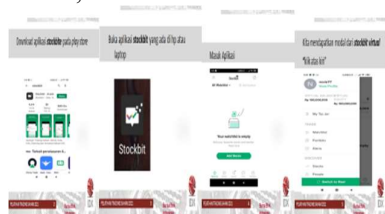
Gambar 5. Teknik pada aplikasi stockbit

Pendampingan trading saham ini peserta didampingi melakukan jual beli saham, melihat portofolio saham yang sudah dibeli dan melihat isu berita perusahaan-perusahaan yang terdaftar di Bursa Efek Indonesia pada saat ini. Mengelkan step-step yang harus dilakukan dalam jual beli saham.