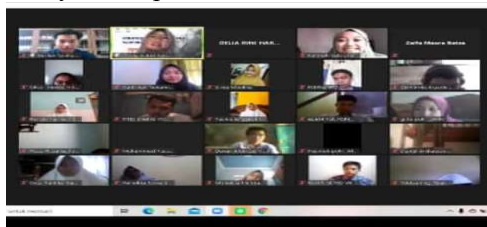
Gambar 1. zoom meeting dalam pelaksanaan pendampingan trading saham

Pelaksanaan kegiatan Pendampingan Trading Saham Untuk Mahasiswa Universitas Pawyatan Dhaha Kediri yang dilaksanakan antara tanggal 3 Mei 2021 sampai 22 Mei 2021 dengan participant sebanyak 275 peserta.