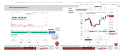
Gambar 8. Trading beli saham secara langsung di lantai bursa

Metode pendampingan ini peserta bisa langsung melakukan jual beli saham di Bursa Efek Indonesia dengan didampingi secara langsung dengan melakukan protokol