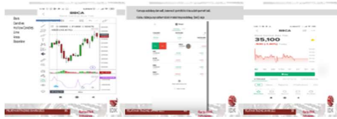
Gambar 9. Trading jual saham secara langsung di lantai bursa

kesehatan karena saat ini masih ada Covid-19.