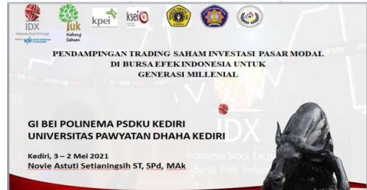
Gambar 2. Materi Trading Saham

Materi yang diberikan kepada peserta pendampingan trading saham supaya bisa dipelajari dan memberikan gambaran tentang trading saham.